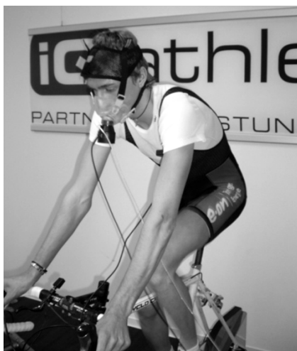
[professionelle Leistungsdiagnostik für alle Sportarten!]

iQ athletik GmbH • Steinrutsch 3 • 65931 Frankfurt • www.iq-athletik.de